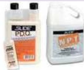
Compuestos Purgantes (P.D.Q) (N.P.T)