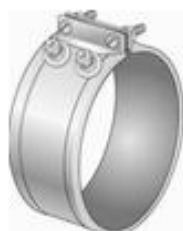
Bandas de Calefacción