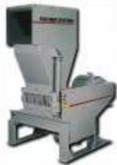
Molinos y Separadores Finos