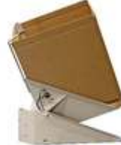
Inclinadores Neumáticos de Gaylords