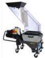
Molinos de Bajas Revoluciones