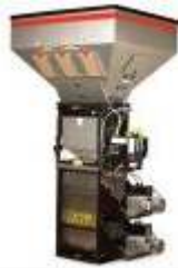
Mezclado y Dosificación de Materiales