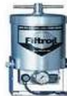
Sistemas de Filtrado