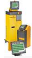
Control de Colada Caliente