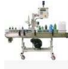
Sistemas de Detección de Fugas en Envases