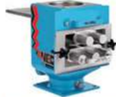
Imanes / Equipos de Separación