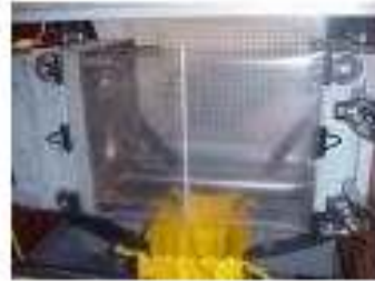
Cortinas para Molde