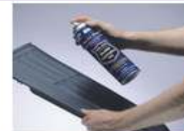
Revestimientos para Reparación de Defectos