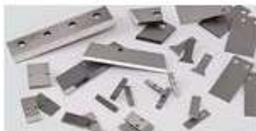
Cuchillas para Pelitizadoras