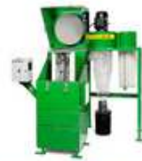
Maquina Limpiadora de Cartuchos Filtrantes