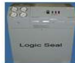
Equipos de Presión negativa para evitar fugas.