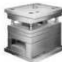
Bases de Molde