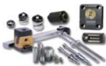
Componentes Para Moldes