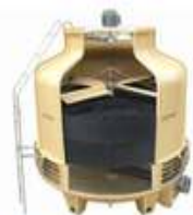
Torres de Enfriamiento