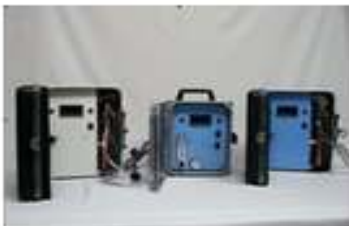
Detectores de Punto de Rocío