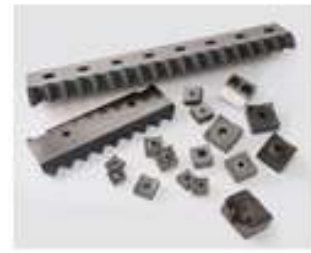
Cribas y Bloques para Trituradores