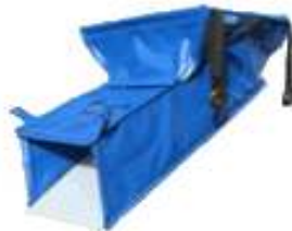
Dispositivos para dirigir la caída de Piezas.