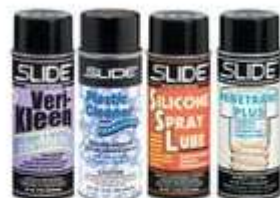
Aerosoles para Mantenimiento Industrial General