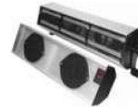
Control de Electricidad Estática