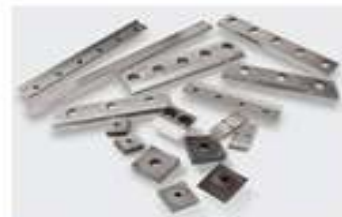
Cuchillas y Cribas para Molinos