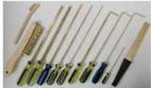
Herramientas para Moldes