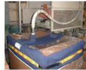
Cubiertas para Tambores y Gaylord