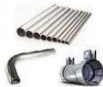
Tuberías y Accesorios