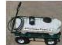
Sistema para Limpieza de refrigeración de moldes