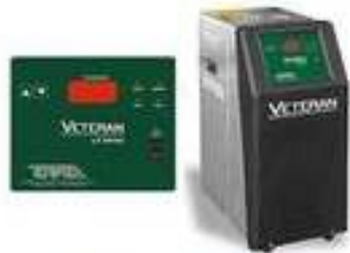
Controles de Temperatura