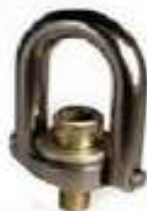
Anillos de Izaje, Eslingas y Cadenas