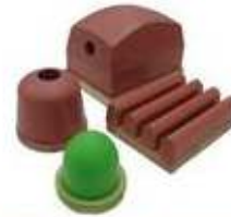
Maquinas de Impresión, Tintas, Placas y Pads