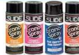
Línea Económica Lubricante, Limpiador Desmoldante