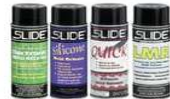
Desmoldantes, Lubricantes y Limpiadores