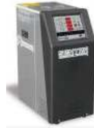
Sistemas de Enfriamiento y Reguladores de Temperatura