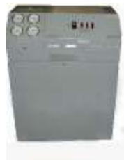
Sistemas de Eliminación de Fugas en Molde