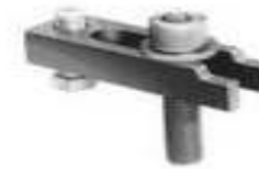
Mordazas (Mold Clamps)