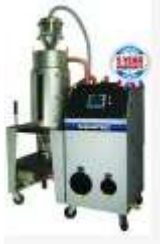
Manejo y Secado de Materiales