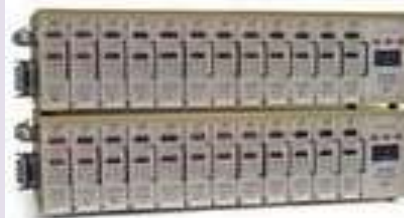
Control de Colada Caliente