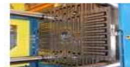
Equipos para Cambio Rápido de Molde